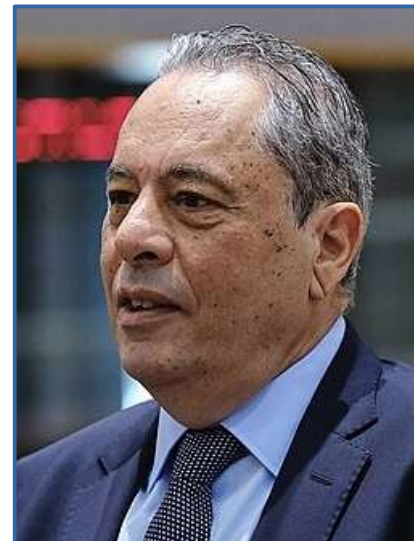
Vasilis Palmas en 2024.

Toutes ensemble, ces initiatives visent à renforcer les capacités industrielles, à favoriser la coopération transfrontalière et à garantir que l'Europe puisse réagir rapidement face à l'évolution des menaces sécuritaires.