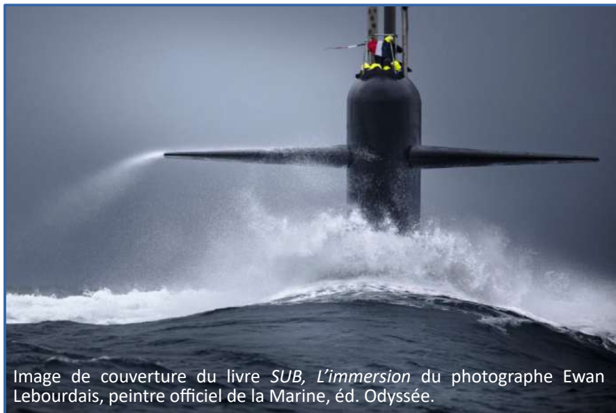
Image de couverture du livre SUB, L’immersion du photographe Ewan Lebourdais, peintre officiel de la Marine, éd. Odyssee.

La crédibilité de la dissuasion, c’est à la fois une crédibilité politique, une crédibilité technologique et une crédibilité opérationnelle.