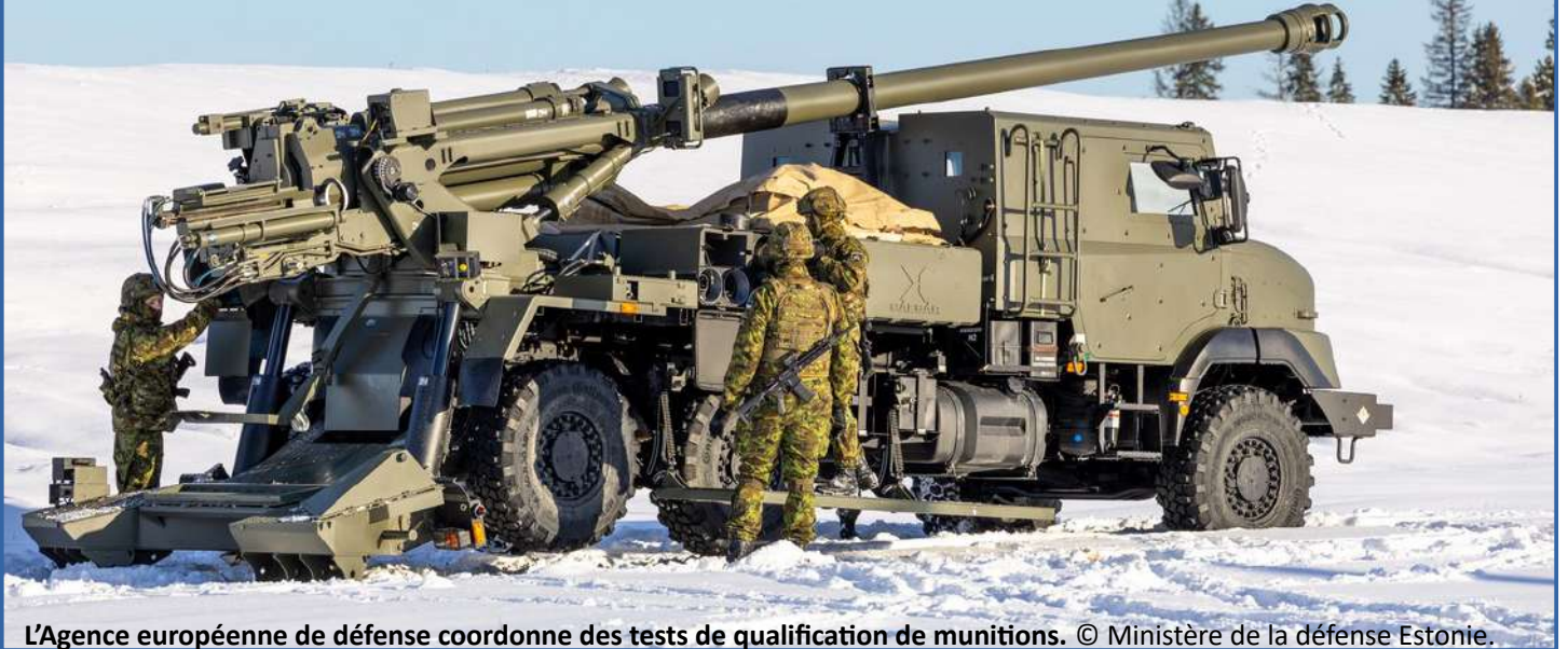
L'Agence européenne de défense coordonne des tests de qualification de munitions.

Alors que les tensions géopolitiques s'intensifient et que les États-Unis recentrent leurs priorités, l'Agence européenne de défense est au cœur d'un pari ambitieux : transformer une industrie de l'armement fragmentée en un acteur mondial compétitif et autonome.