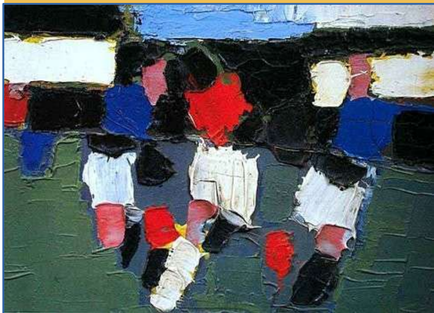
↑ Parc des Princes par Nicolas de Staël, 1952, collection privée. Les joueurs sont reconnaissables sans être identifiables, le public non plus en fond de tableau. Seule l'action de jeu est perceptible dans un dynamisme particulièrement marqué. Dans bien des groupes, le sens collectif est fondamental pour s'accomplir.

Notre défi est désormais de bâtir un nouveau système pérenne pour développer durablement les réalisations du trinôme académique, en couvrant tout le spectre depuis les élèves du premier degré jusqu'à la formation continue des enseignants.